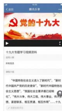
党员视频课程专区 视频学习分享，党员学习方式更丰富