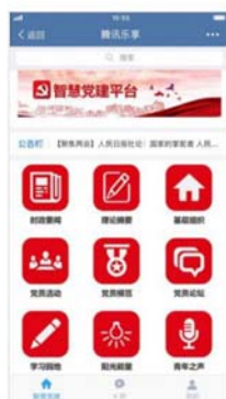
党建平台手机版 手机随时访问，显示区块可配置