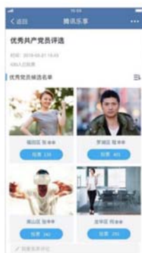
优秀党员与优秀事迹评选 在线投票评选优秀党员，多终端展示